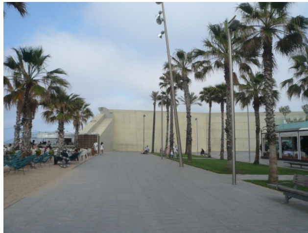
Figura 3. Final del Paseo Marítimo contra el espaldón.

Existen elementos en el entorno de gran protagonismo, como el Hotel W, conocido como "Hotel Vela". El ajuste de la obra marítima (el dique que protege al hotel y su altísimo espaldón, prolongado a causa de severos temporales) con el Paseo que entronca con él, no ha resultado acertado. Yendo a pie, las imágenes en esa zona son desalentadoras: