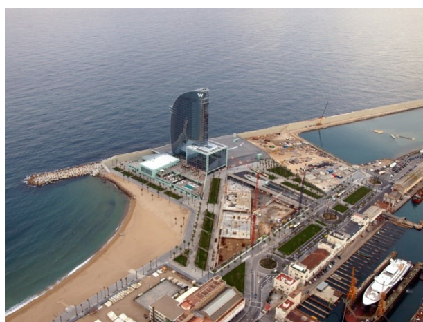
Figura 2. Vista general del entorno inmediato.

Planteado así, parece tratarse únicamente de un problema de dinámica litoral, un tema habitual en la ingeniería costera. Pero la cuestión se torna más compleja si introducimos los datos del entorno. Veamos cómo es ese paisaje: